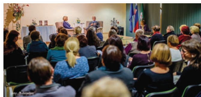
Obiskovalci so dvorano napolnili do zadnjega kotička.

zasedeni dvorani spominjali težkih, a tudi lepih trenutkov.