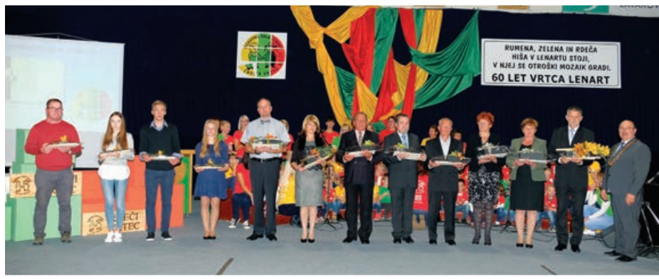
Prejemniki priznanj in nagrad Občine Lenart

Občina Lenart vsako leto podeli priznanja in denarne nagrade študentom, ki so svoje študijske obveznosti, vključno z diplomskim delom, magistrsko nalogo ali doktorsko disertacijo, opravili s povprečno oceno 9,1 ali