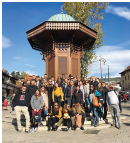
V Sarajevu ...

Dneve med 28. 10. in 30. 10. smo ŠKSG-jevci preživel na tradicionalnem jesenskem izletu, tokrat v Bosni in Hercegovini. Prvi dan smo si ogledali Mostar, skrivnostni Titov bunker v Konjicu in nato dvakrat prenočili v Sarajevu. Dnevi so bili polni zabave, smeha, prijetnega druženja in seveda čevpčičev. Zadnji dan je bil na sporedu še ogled mesta Travnik in rojstne hiše Iva Andrića ter mesta Jajce. Vožnja domov je hitro minila in tudi čakanje na meji nas ni spravilo v slabo voljo.