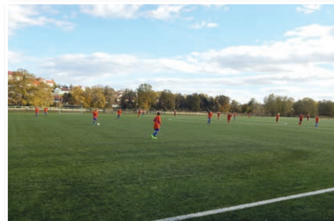
Tekme ob otvoritvi igrišča z umetno travo

predstavi Dino in čarobni toni je bilo otroške igrivosti in vesela v izobilju. Smej se, ko je le