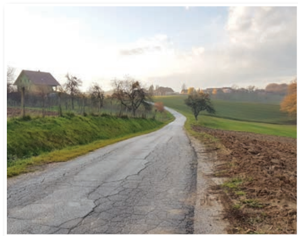
Razširitve in rekonstrukcije bo prihodnje leto deležna cesta v Vardi

Pred bližajočo se zimo so pogosta vprašanja o pripravljenosti izvajalcev zimskih služb, ki skrbijo za prevoznost lokalnih javnih cest. V jurovskem občinskem proračunu je predvidenih 40.000 € proračunskih sredstev za izvajanje zimskih služb, kar bi naj glede na zadnji