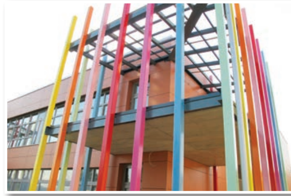
V prejšnji evropski finančni perspektivi je občina Benedikt s pomočjo sredstev iz Evropske unije zgradila nov vrtec, ki so ga nujno potrebovali.

V prejšnji evropski finančni perspektivi se je občina Benedikt izredno hitro razvijala tudi zahvaljujoč sredstvom, ki jih je za določene investicije in razvojne programe občina uspela pridobiti iz bruseljske blagajne. Tako je občini Benedikt po besedah Gumzarja v preteklosti na razpisih uspelo pridobiti evropska sredstva za izgradnjo in modernizacijo cest, za izgradnjo kanalizacije in vodovoda, za izgradnjo novega vrta in še bi lahko naštevali. V prejšnji finančni perspektivi je namreč Evropska unija znatna sredstva namenila za sofinanciranje komunalne infrastrukture v lokalnih skupnostih, kar je bilo »napisano na kožo« potreb ljudi tudi v manjših podeželskih občinah.