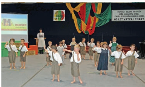
Bogat, domiseln, kakovosten in ganljiv program otrok in vzgojiteljic vrtca Lenart - najmlajši folkloristi