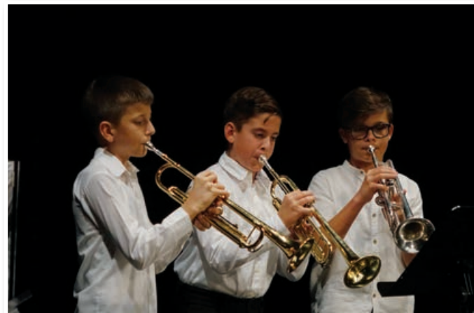
Jesenski koncert Glasbene šole Lenart

V Galeriji Konrada Krajncja je bila otvoritev razstave slik 12. Mednarodne likovne delavnice za mlade, ki je bila v poletnih mesecih na otoku Krku. Program razstave je popestril Adi Smolar. Likovno ustvarjalnost podpirajo tudi v VDC Polž - enota Lenart, otvoritev razstave slik, ki so jih ustvarili uporabniki VDC Polž je bila v Avli Jožeta Hudalesa. Tradicionalni koncert, ki so ga organizirali v lenarški enoti VDC Polž, na katerem