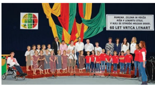
Otroci iz vrtca in varovanci VDC Polž – enota Mravljja Lenart so zapeli skupaj.